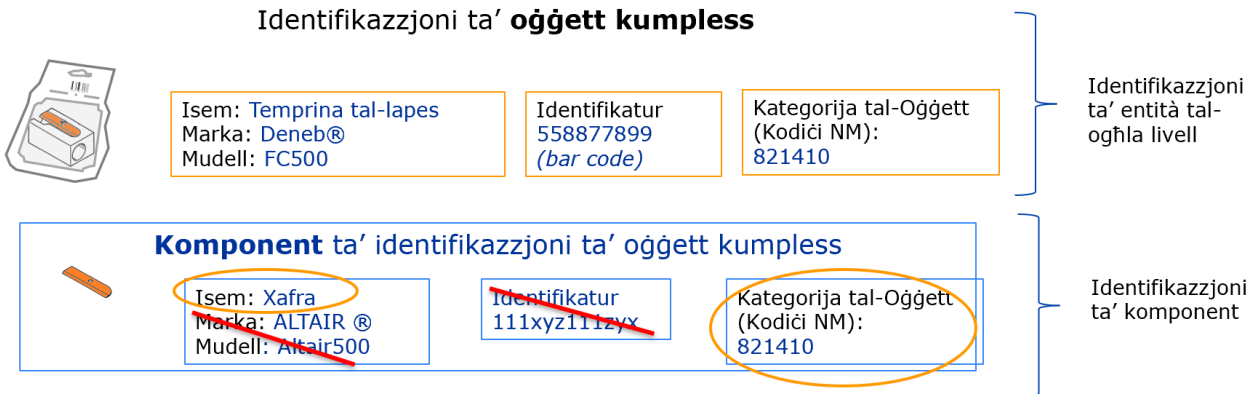
Figura 2: Protezzjoni ta' informazzjoni kunfidenzjali skont il-Bażi ta' Data tal-SCIP.

Il-Bażi tad-Data tal-SCIP ma tiżvelax ir-rabta bejn in-notifika u min ikun qed jibgħat it-tagħrif tagħha. L-informazzjoni ingassata tikkorrispondi għall-Entità Legali li tissottometti notifika tal-SCIP għax-xafra, għall-vit u għat-temprina tal-lapes. Il-Bażi tad-Data tal-SCIP ma tippubblikax l-ismijiet u l-kuntatti ta’ dawn l-Entitajiet Legali li jissottomettu notifika tal-SCIP.