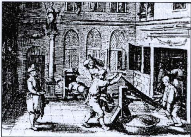
Foglalkozás a Rasphuis börtönben

tékelése, a nevelés ideája a polgári életeszmeny terjedésekor, a kapitalizáció társadalmi expanziója idején, a reformáció és ellenreformáció harcában alakult ki.