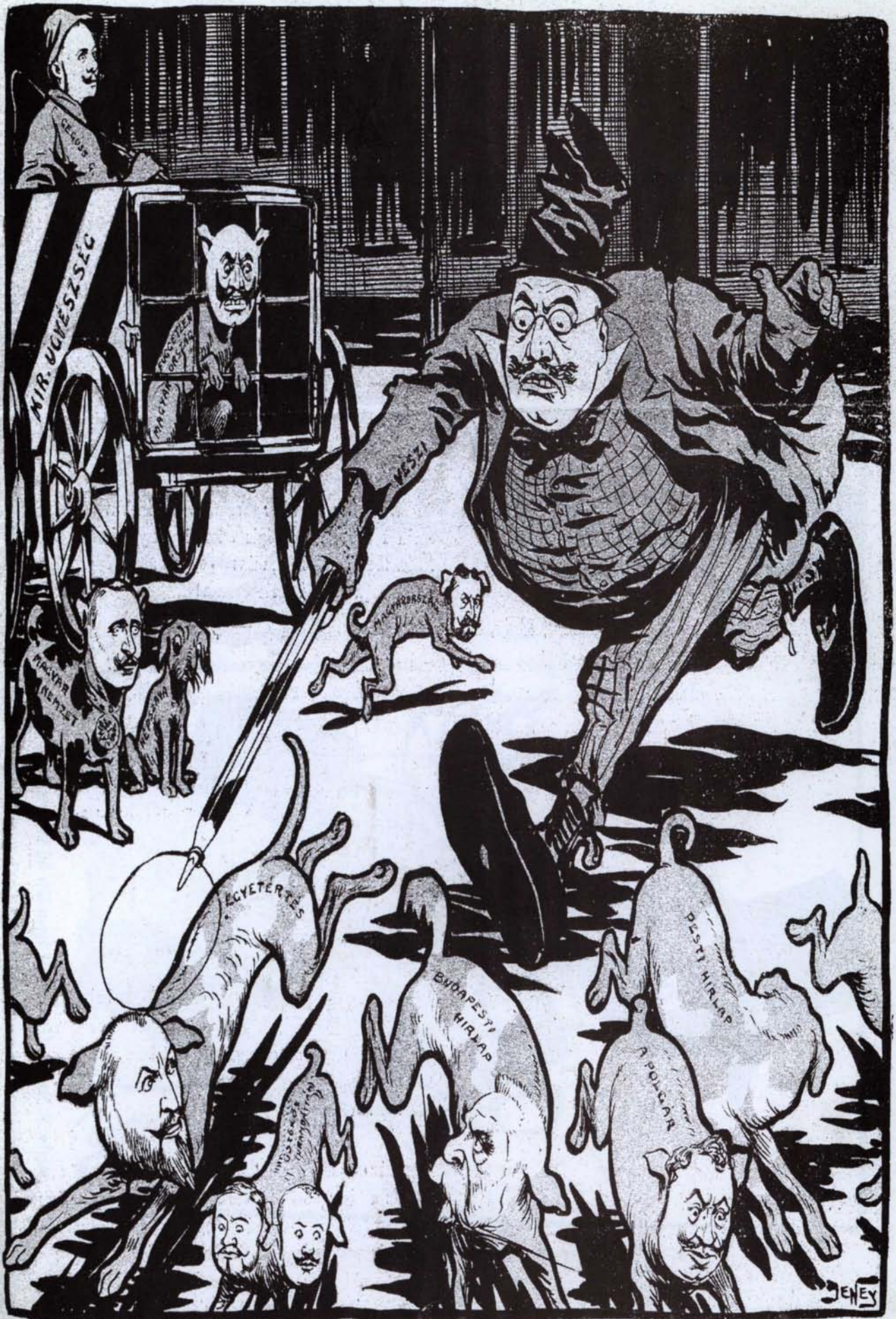
A Bach-korszak után a Bachus-korszak, vagy a cenzor úr munkában.