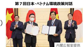
第7回日本・ベトナム環境政策対話