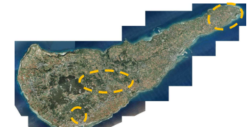
沖永良部島全景と脱炭素先行地域対象エリア