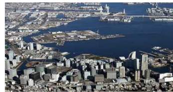
みなとみらい21含む市内沿岸部