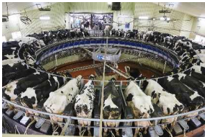
酪農施設（搾乳設備）