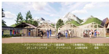
環境配慮型栽培ハウスのイメージ