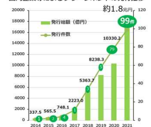
国内企業等によるグリーンボンドの発行推移