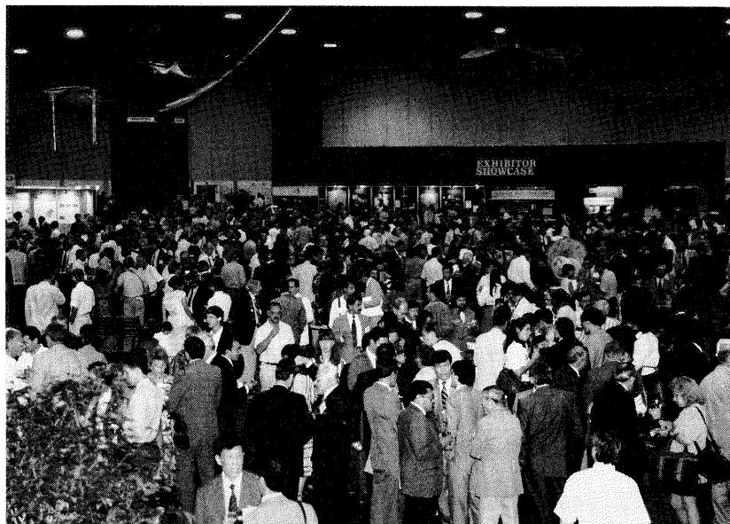
The Exhibitors' Reception