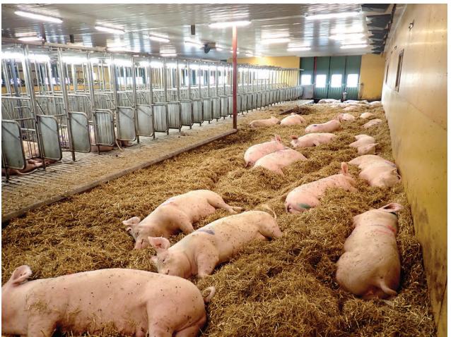
Sauen im Deckzentrum (Rückzugsmöglichkeit im Auslauf)