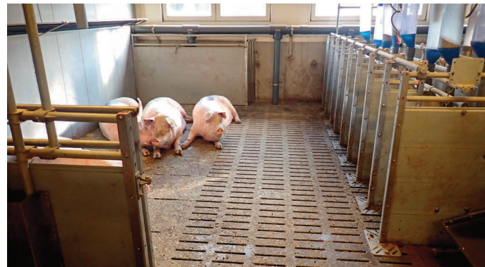
Sauen im Deckzentrum ohne Kastenstände (Beschäftigungsmaterial und Rückzugsmöglichkeit in nicht sichtbarem Bereich)